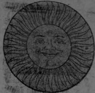
El Sol que a usted ayuda cuando necesita más.

COMPANIA DE ECONOMIAS Y ACCIDENTES Y ENFERMEDADES, AUTORIZADA POR EL GOBIERNO FAVORABLES MODIFICACIONES PARA 1917